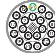
色比率 Color ratio G/Y (G:Y=6:4)