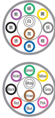
例) 10芯 ex) 10c