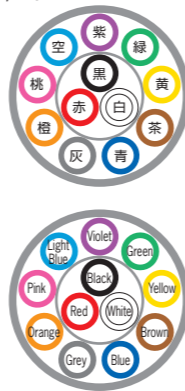
例) 12芯 ex) 12c