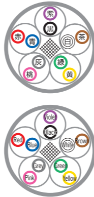
例) 5対 ex) 5P