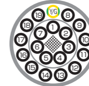
色比率 Color ratio Y/G (Y:G=6:4)